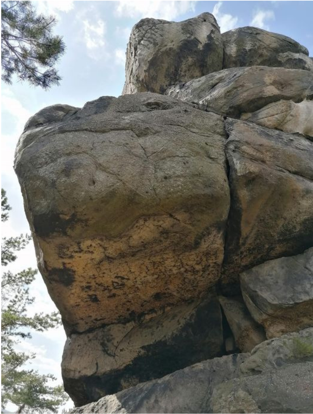
Obrázek č. 1/2