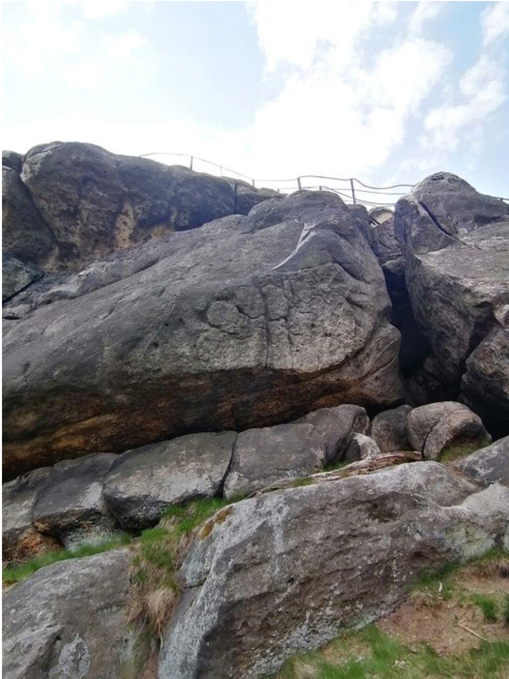
Obrázek č. 1/2