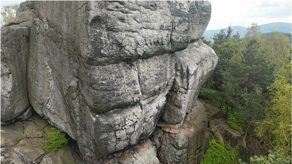
Obrázek č. 1/2