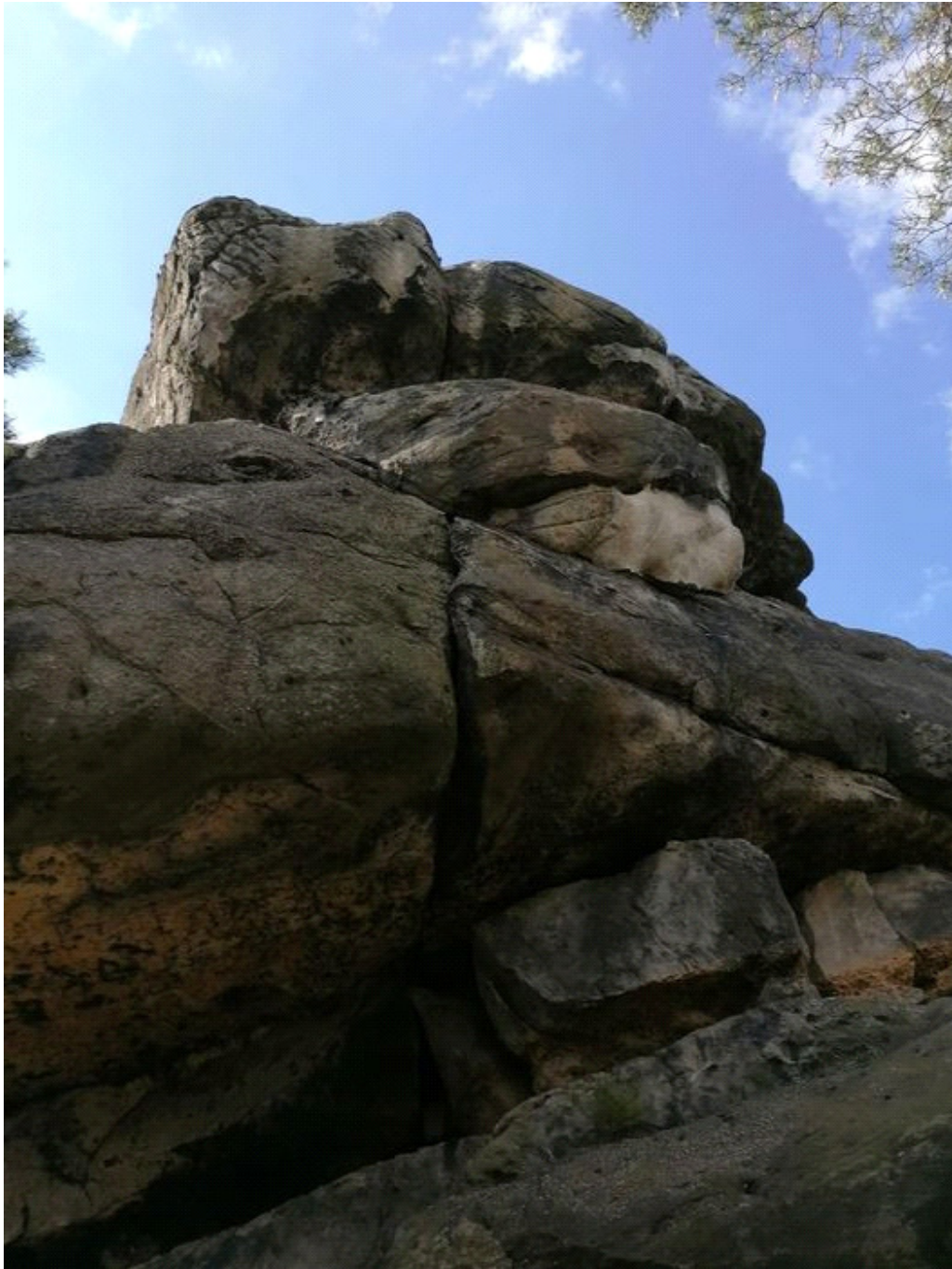
Obrázek č. 1/1