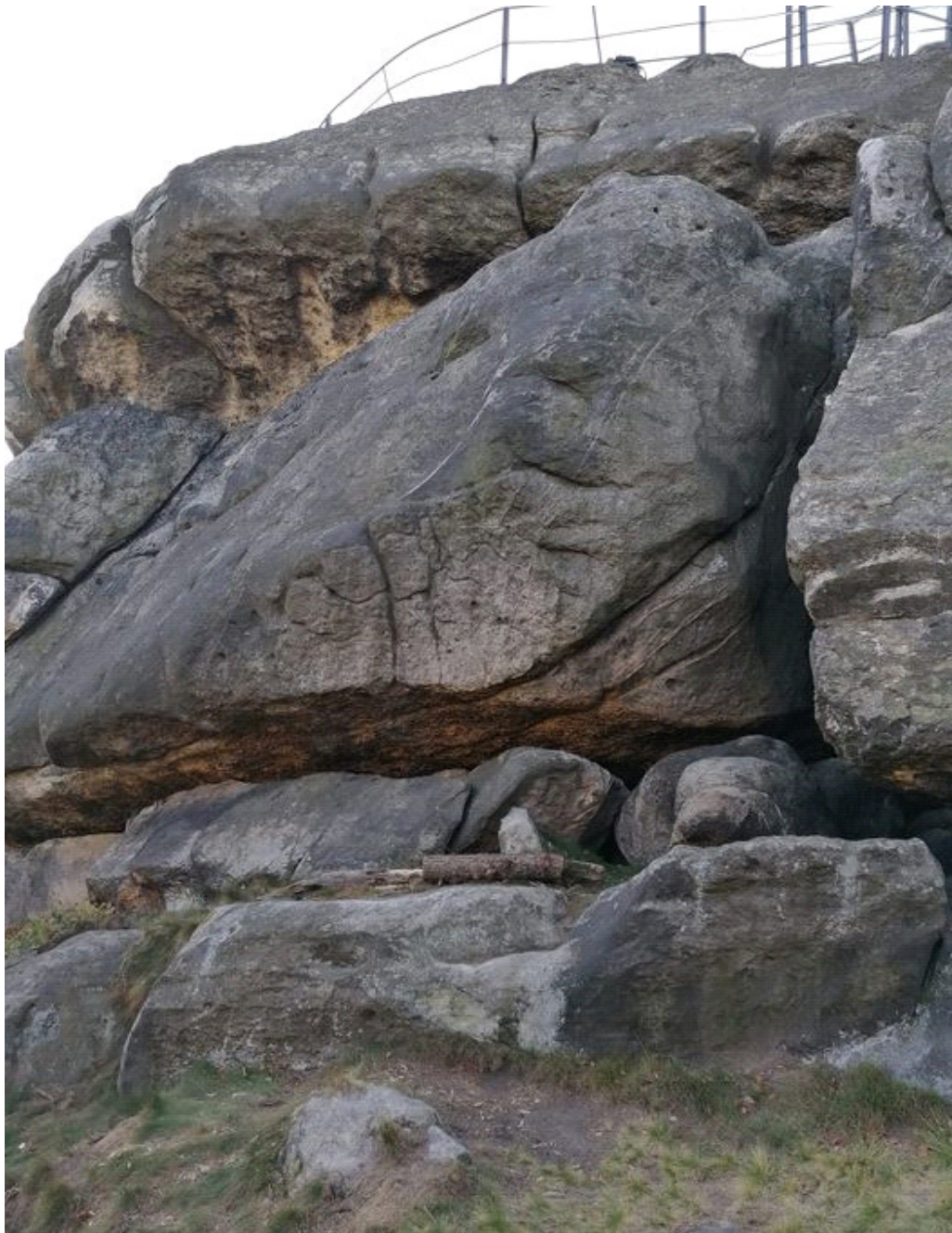
Obrázek č. 1/1