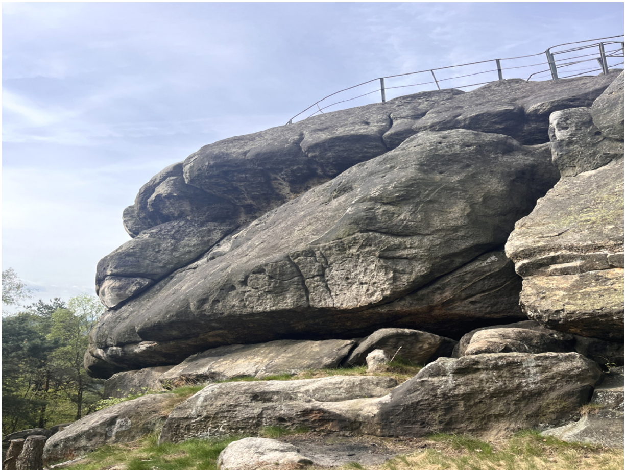
Obrázek č. 1/3-1