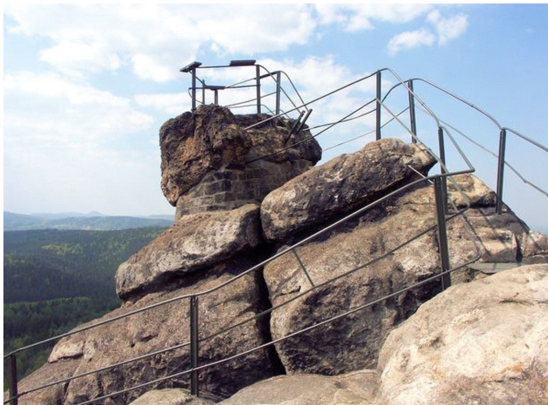
Obrázek č. 1/1

Jižní strana Perunovy hlavy s vytesanými tvářemi (obrázek č. 6). Ty jsou patrné i na dalších kamenech. Vlevo nahoře hned pod vrcholem je pak kámen, pravděpodobně upravený do podoby kozlí hlavy (vlevo obličejová část – jedná se o zvíře zasvěcené Perunovi). Pod ním lze rozeznat medvědí hlavu (jedno ze zvířat zasvěcených bohu Velesovi).