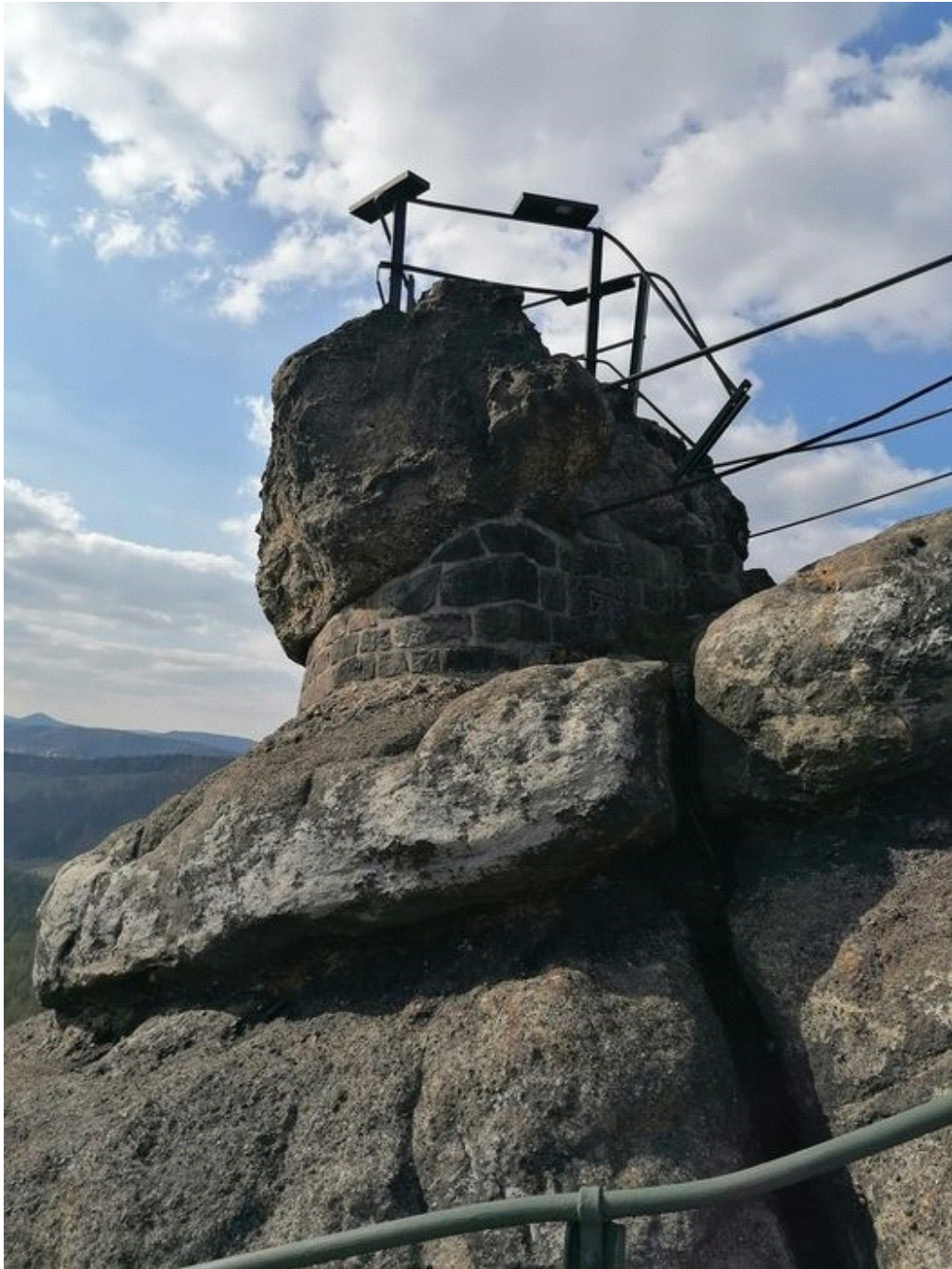
Obrázek č. 1/2