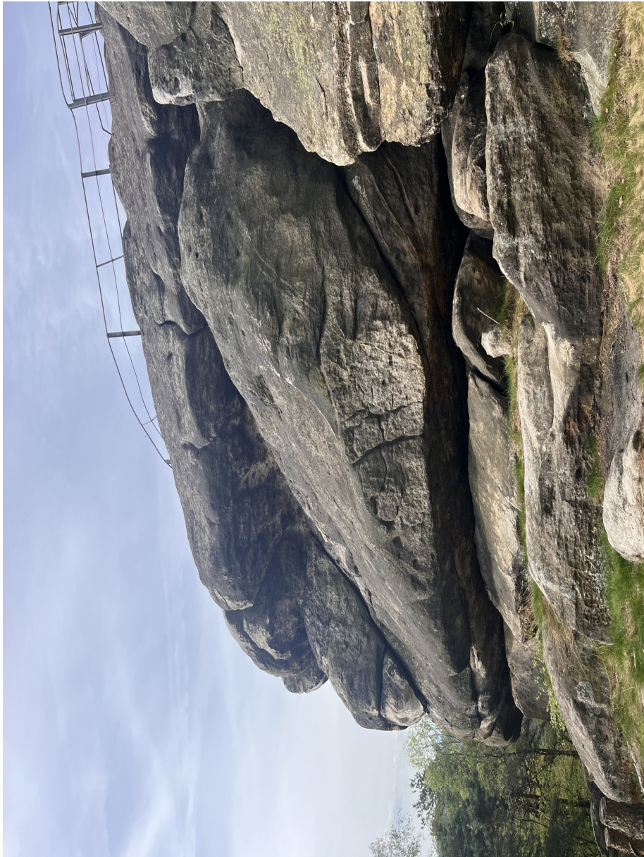
Obrázek č. 1/3-2