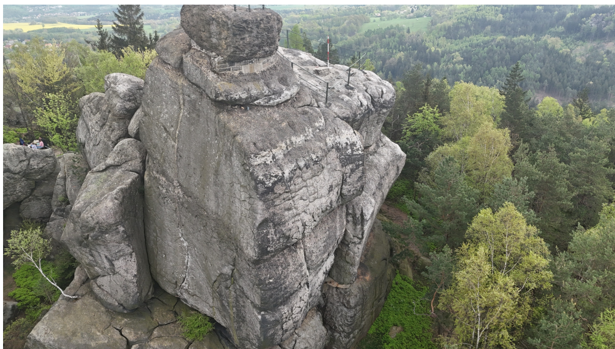
Obrázek č. 1/1

Také na západní straně Perunovy hlavy je zřetelně vidět vytesaná tvář. Tváře se nacházejí i na těle z této strany.